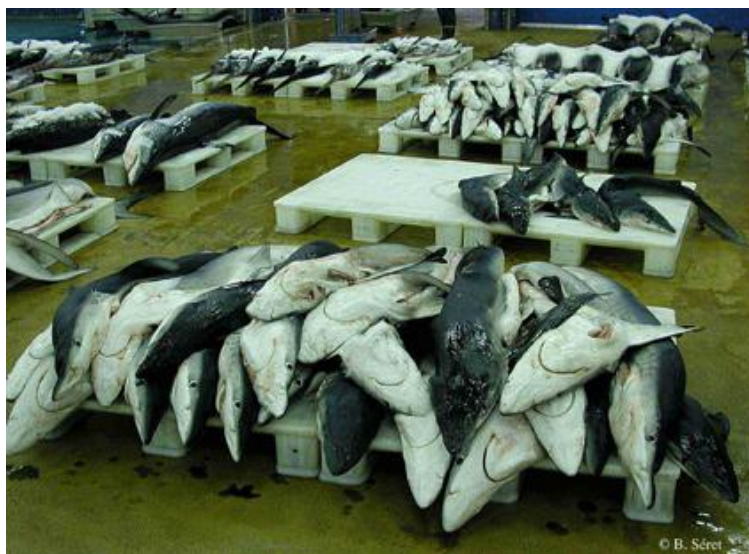
Figure 1. Criée de Vigo en Espagne avec des palettes de requin peau bleue Prionace glauca .