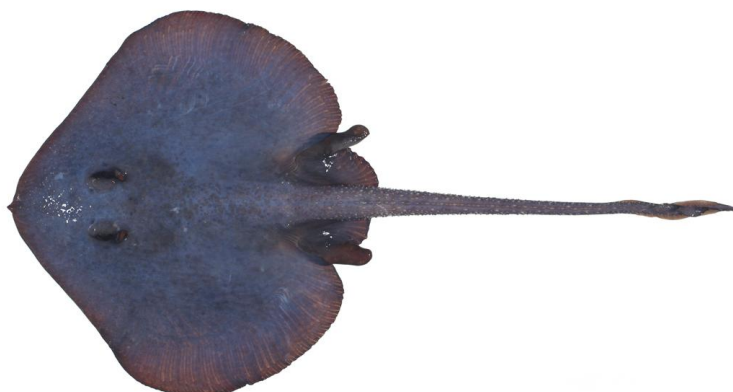
Une nouvelle espèce de raie du Pacifique Sud, Notoraja sapphira .