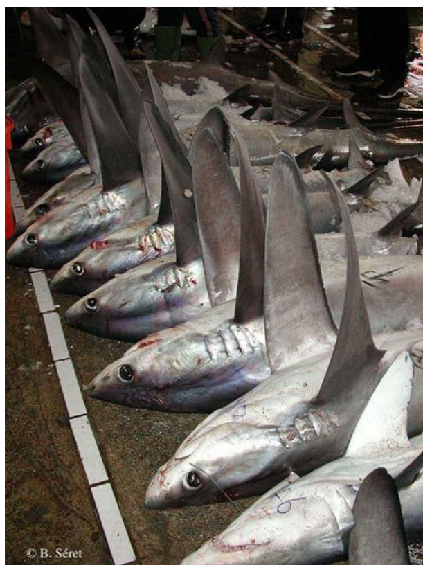
Figure 2. Criée à Taiwan montrant des requins-renards.