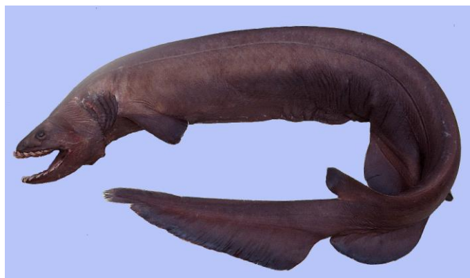
Requin-lézard Chlamydoselachus anguineus du golfe de Gascogne – c'est le requin le plus « primitif » de la faune actuelle.